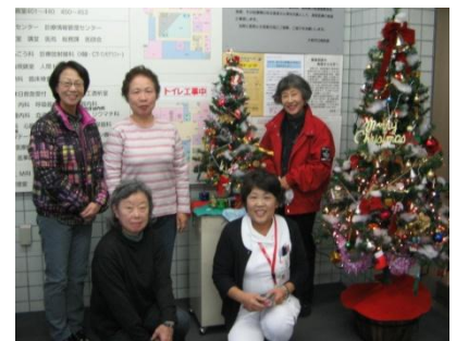
【クリスマスツリー飾り付けの様子】