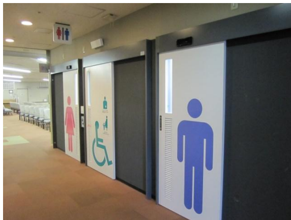
【↑改修後の外来トイレ画像】

今後も患者満足度調査結果などを受け、より良い病院づくりをめざして改善を図ってまいります。