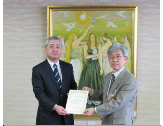
【3月28日、神奈川県庁にて院長が健康福祉局長より指定書の交付を受けました】

これからも専門的ながん治療と、がんに関する様々な情報を提供してまいりますので、皆様よろしくお願いたします。